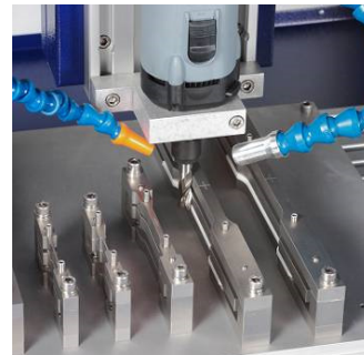
Fräser mit Kaltluftentwickler