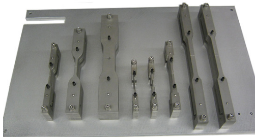
Spannzeug für Zugproben nach DIN EN 527